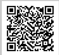
QRコードからも アクセスできます