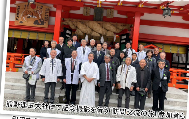
熊野速玉大社にて記念撮影を行う「訪問交流の旅」参加者ら