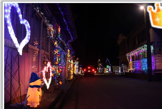
*撮影者：hanamama コメント：中津谷川イルミネーション街道での1枚。この時期は見物客で賑わってますね！ (撮影時期：2022年12月11日/撮影場所：津谷川本宿)