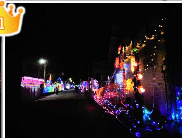
*撮影者：ikayuromu コメント：やっぱり中津川イルミネーション街道は外せませんね！毎年の楽しみです♪ (撮影時期：2021年12月11日/撮影場所：津谷川本宿)

13年続く中津谷川イルミネーション同好会さんの取り組みに、街道の写真も2枚エントリーされました！この季節の自慢の景色ですね！