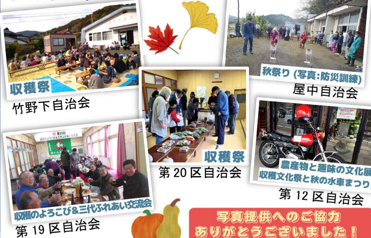
収穫祭 竹野下自治会

11月に突入し、コロナ禍前のように実りの秋を祝うお祭りや秋の自治会行事が、ぞくぞくと各所で開催されました。新型コロナウイルス感染症の影響で、これまで開催を自粛していた地区も多かったことから、久しぶりの再開に、笑顔が溢れていました。