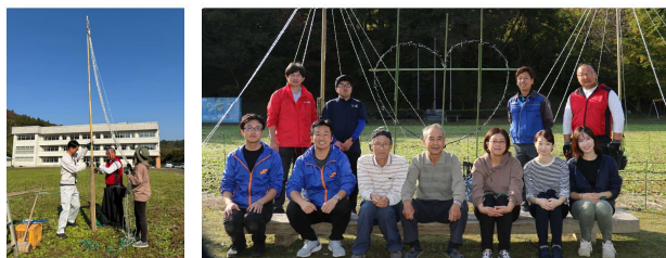
中津谷川イルミネーション同好会を応援!