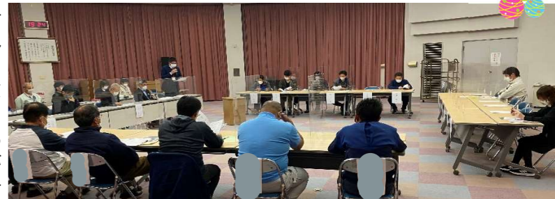
▶多くの意見がある中、会場装飾も含め、子どもが参加して楽しめるイベントが必要では?という意見が賛同を集めていました。

第1回目となった今回は、これまでの夏まつりについて思うことや、実行委員会で実施した夏まつりアンケートの回答についてなど、意見交換や大きい部分の方向性について話し合いました。今後、定期的に検討チーム会議を開催し、年内で検討内容をまとめ、実行委員会へ提案していく予定です。