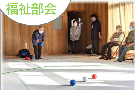
▲14区ふれあいサロン ボッチャの様子

生活福祉部会では、令和元年度からレクリエーショングッズの貸し出しを行っています! レクリエーショングッズとは、コミュニケーションの活性化を図りながら、楽しく脳や身体機能の向上を図るためのグッズで、自治会サロンやカフェの集まりなどを中心に、様々なコミュニティでご活用いただけます。