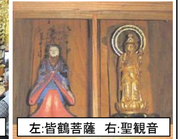
左:皆鶴菩薩 右:聖観音