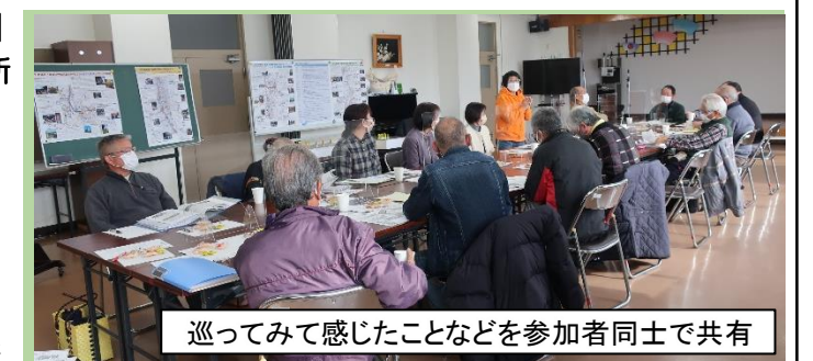
巡ってみて感じたことなどを参加者同士で共有

12月16日(金)これまでのまとめを行いました。参加した皆さんからは「貴重な資料も見られて驚いた」「また開催してほしい」などの声が聞かれました。