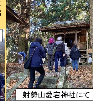
射勢山愛宕神社にて