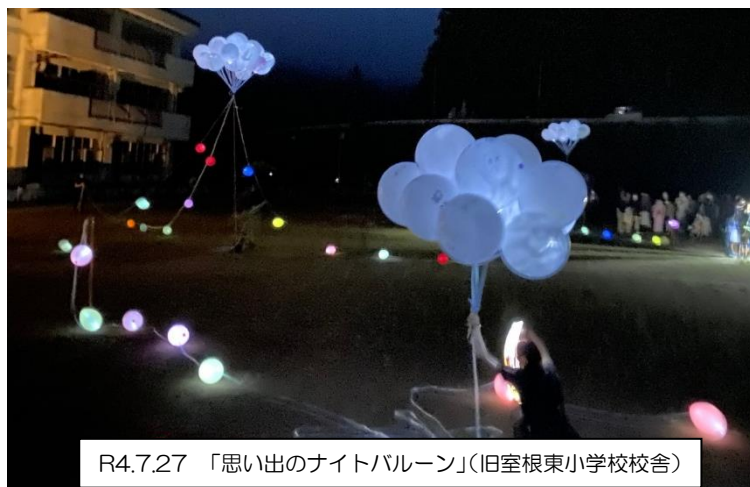
R4.7.27 「思い出のナイトバルーン」(旧室根東小学校校舎)

8月18日(木)の始業式では、式後、完成したての新校舎の中をみんなで探検し、わくわくした新たな気持ちで、これからの学校生活をスタートしていました。