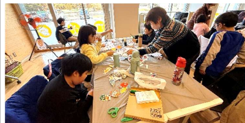
手作りのつるし飾りで、華やかなミズキ飾りができました！