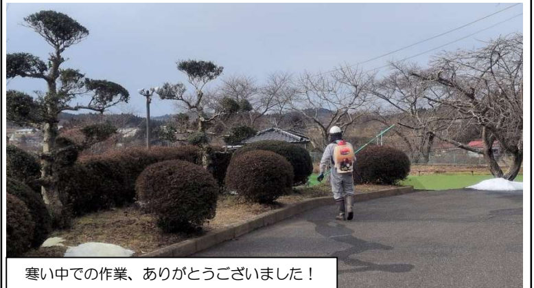
寒い中での作業、ありがとうございました！

1月17日(土)室根市民センターでは「むろね山野草の会」の皆さんによる庭木の病虫害防除の薬剤散布が行われました。病虫害防除は新芽が出る前の寒い時期に実施するため、毎年この時期に作業が行われています。