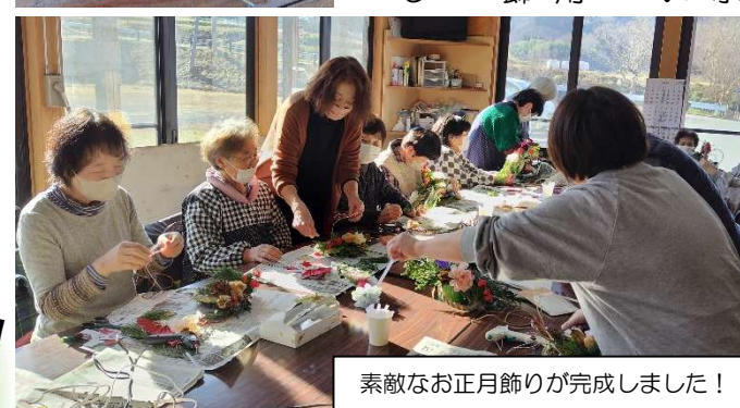
素敵なお正月飾りが完成しました！