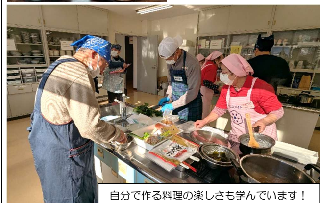
自分で作る料理の楽しさも学んでいます！