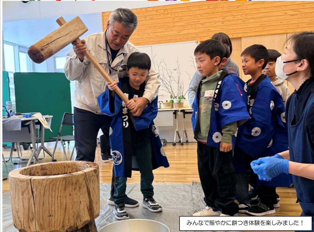
みんなで賑やかに餅つき体験を楽しみました！