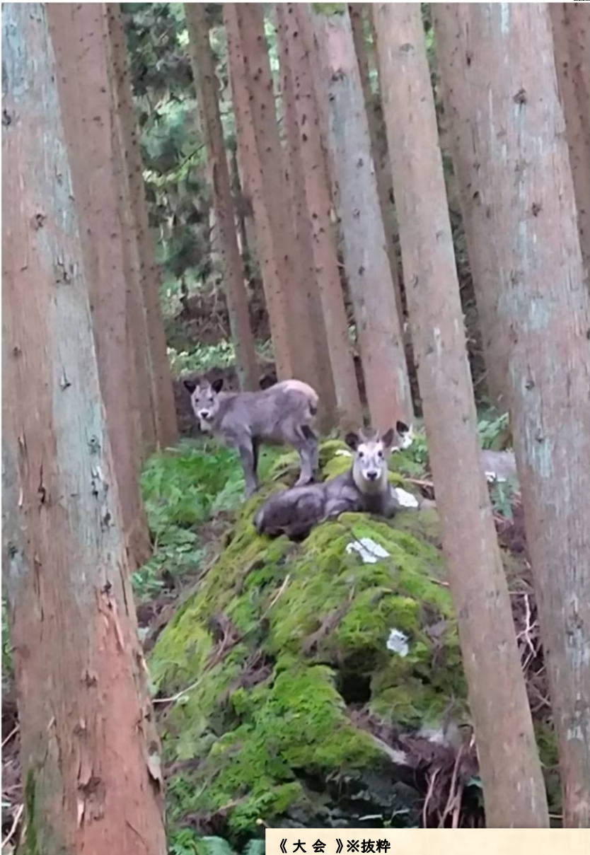
《大会》※抜粋 ・9月10日(火)第35回(株)岩辰杯ゲートボール大会