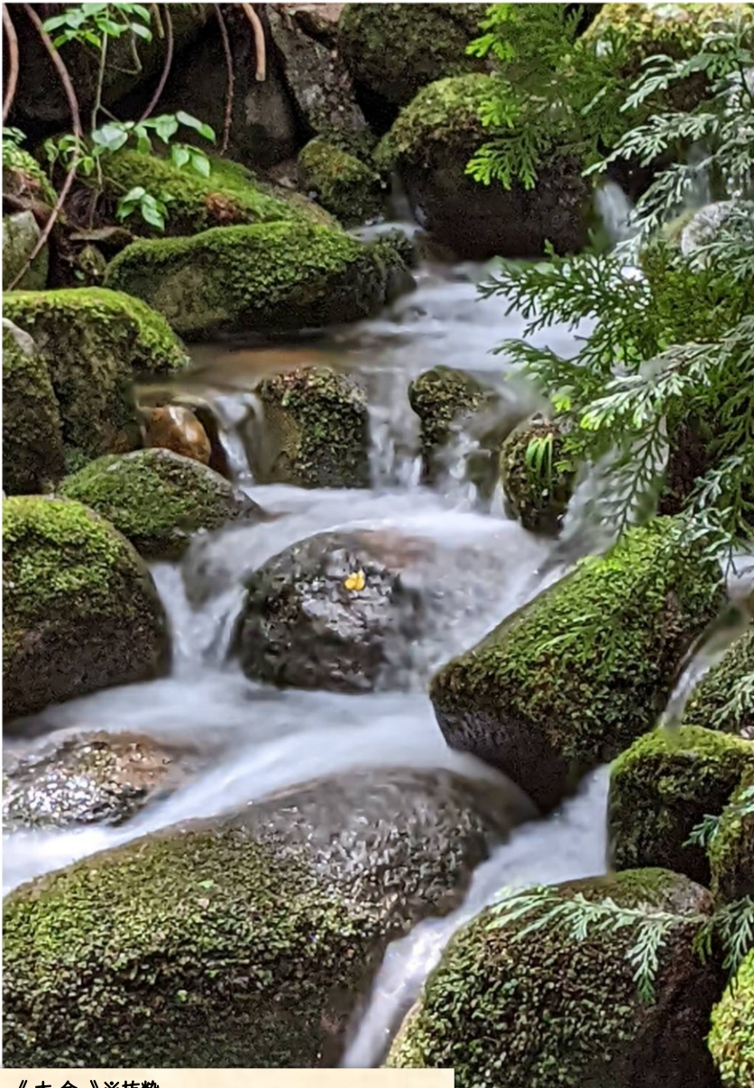
《大会》※抜粋 ・7月7日(日)第34回室根自治会対抗が-トホ-ル大会