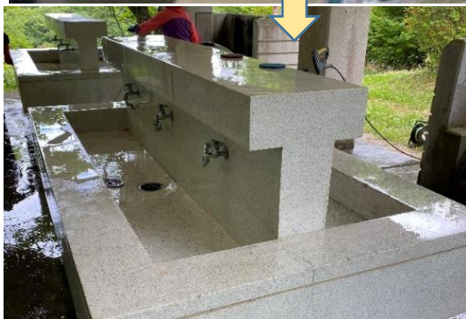
作業後：コケも一掃！気持ちよく使えます