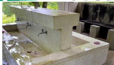
作業前：洗い場にはコケや詰まったゴミが…！