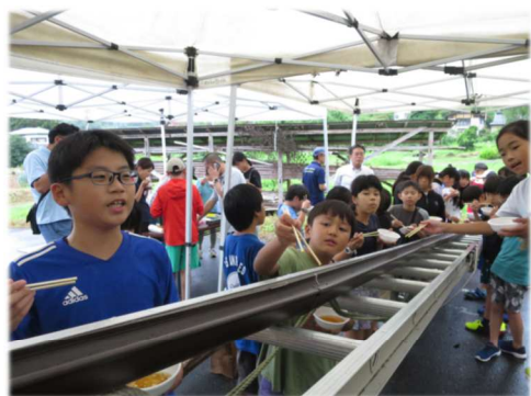
流しそうめんなどを楽しむ 吉川市の子どもたち

両市主催のこの事業には、室根・吉川交流協会と吉川・室根交流協会が共催。冬には室根の児童が吉川市を訪問する予定になっています。