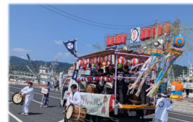
気仙沼みなとまつりパレードにて演奏

古くから続く気仙沼市との交流の絆を絶やしたくないという思いで参加を続けて、今年が13回目。パレードの会場となったのは港町臨港道路約500m区間。メンバーは、装飾されたトラックの上や徒歩で力強いうちばやし演奏を披露し、室根神社特別大祭のPRのために参加した「みこシスターズ」と共に会場を賑わせていました。また、クラウドファンディングも開始されたことから、チラシの配布も行い、PRしました。