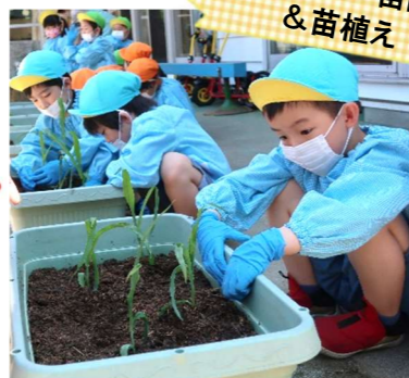
保育施設へ苗配布 & 苗植え

5月末に栽培用の堆肥を受け取りに一関の佐々木牧場へ！6月中旬に各保育施設へ栽培セットを配布し、子ども達が苗を植えました♪