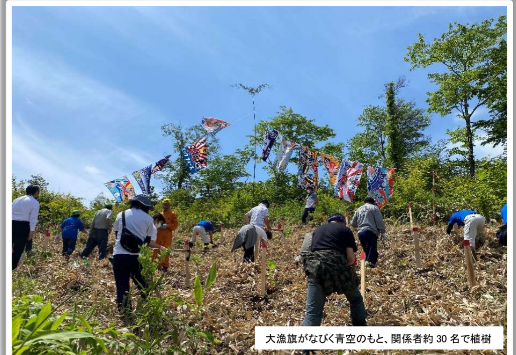
大漁旗がなびく青空のもと、関係者約30名で植樹