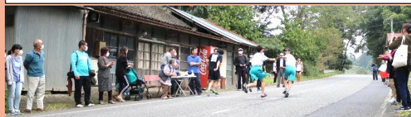
↑沿道からの声援を受けながら襷を繋ぐ中学生チーム