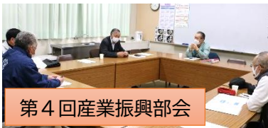
第4回産業振興部会

また、遊休農地の有効利用と産業発展に向け、三升漬け以外のチームも作れないか検討していく事としました。