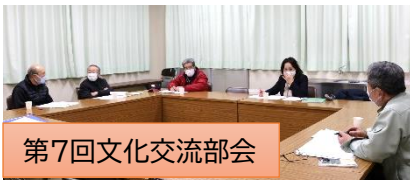
第7回文化交流部会

に上がっていた『室根の歴史や大祭、神社』についてまとめた冊子作りを重点的に行っていく事としました。