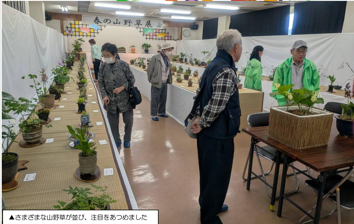
▲さまざまな山野草が並び、注目をあつめました