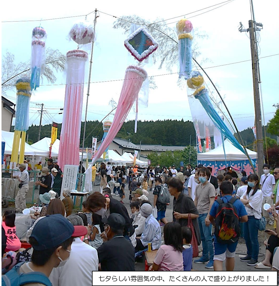
七夕らしい雰囲気の中、たくさんの人で盛り上がりました!