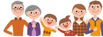
みこシスターズとじゃんけん大会!