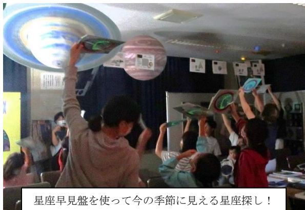
星座早見盤を使って今の季節に見える星座探し！