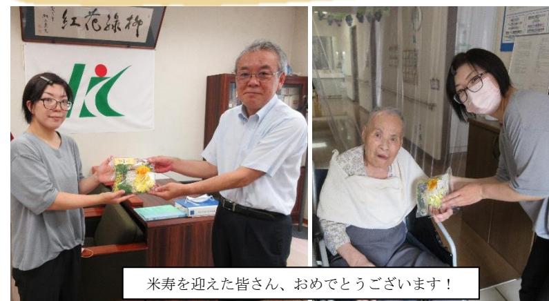
米寿を迎えた皆さん、おめでとうございます！

室根市民センター青年ふれあい塾では、9月18日(祝・月)の敬老の日に合わせて、室根地域で米寿を迎える方を対象に、9月15日(金)・20日(水)にお祝いのプレゼントを贈りました。 プレゼントは、米寿の祝い色である黄色を基調としたリースを、青年ふれあい塾のメンバーが手作りの言葉と「これからも健康で元氣にお過ごしください」のメッセージを添えて、孝養ハイツやグループホームほらん室根へ応募いただいた室根地域にお住まいの対象者の方へ届けました。 皆さんに喜んでいただき、青年ふれあい塾のメンバーも心温まるひと時となりました。